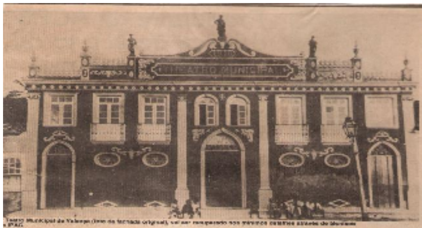
Figura 1 - Teatro Municipal. Fachada original, com as estátuas representando as três economias de Valença.

fotografia abaixo pode se notar a presença de pessoas sentadas nas suas escadarias. Com a reforma tais escadarias também foram retiradas, as janelas das extremidades foram transformadas em aros de ventilação, os arcos das portas foram diminuídos.