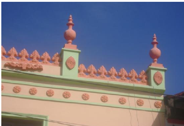
Figura 4 - Fachada do Teatro Municipal, das estatuetas de ornamentação restam apenas 04 peões, dois de cada lado, as representações do comércio, indústria e zona rural já não existem desde o final dos anos 50.

A luta dos populares e dos intelectuais de Valença pela preservação de um patrimônio histórico reconhecido pela comunidade esbarrou na vontade política e no interesse do poder público em investir numa casa de espetáculo de pequeno porte havendo, já na cidade, um centro cultural com capacidade para diversas formas de apresentação, variando de exposições até grandes espetáculos. Os populares e os artistas, porém, não se deram por vencidos e continuaram a buscar uma solução para preservar o Teatro, ainda embasados nas idéias do encontro realizado em 1985, persistiram em reuniões e pressões que acabaram por convencer