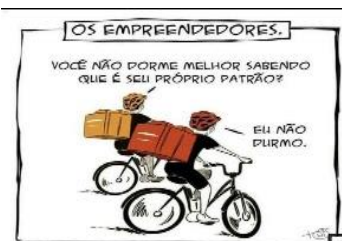
UMA CHARGE REPRESENTANDO SOBRE OS TRABALHO DE APLICATIVO ESTAR Á BEIRA AO TRABALHO ESCRAVO DE ACORDO COM O MINISTRO LUIZ MARINHO

“Nós acompanhamos a angústia de trabalhadores e trabalhadoras dos aplicativos que, muitas vezes, tem de trabalhar 14, 16 horas por dia para poder levar o pão e o leite pra casa. Isso, no meu conceito de trabalho, beira ao trabalho escravo”, disse o ministro.