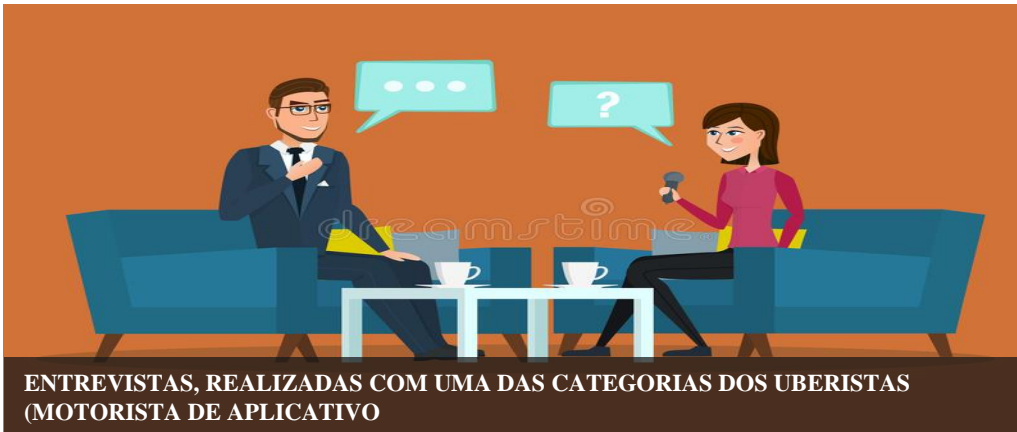
ENTREVISTAS, REALIZADAS COM UMA DAS CATEGORIAS DOS UBERISTAS (MOTORISTA DE APLICATIVO)