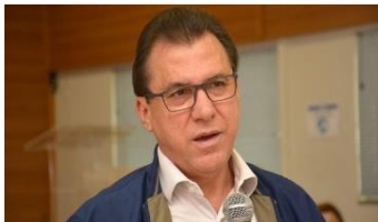
IMAGEM DO MINISTRO DO TRABALHO LUIZ MARINHO

Nesta quarta-feira (18 DE JANEIRO DE 2023), durante encontro com representantes das centrais sindicais, o ministro do Trabalho Luiz Marinho prometeu a criação de um grupo de trabalho para discutir a regularização dos profissionais que trabalham para aplicativos, principalmente os de mobilidade.